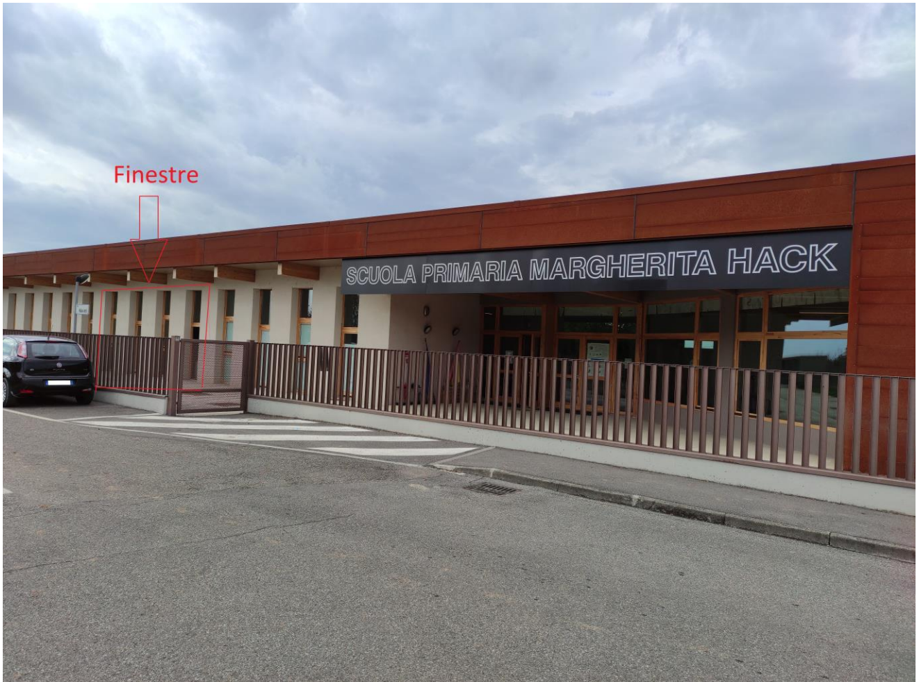
Edificio esterno scuola primaria, zona pre-triage e zona di attesa