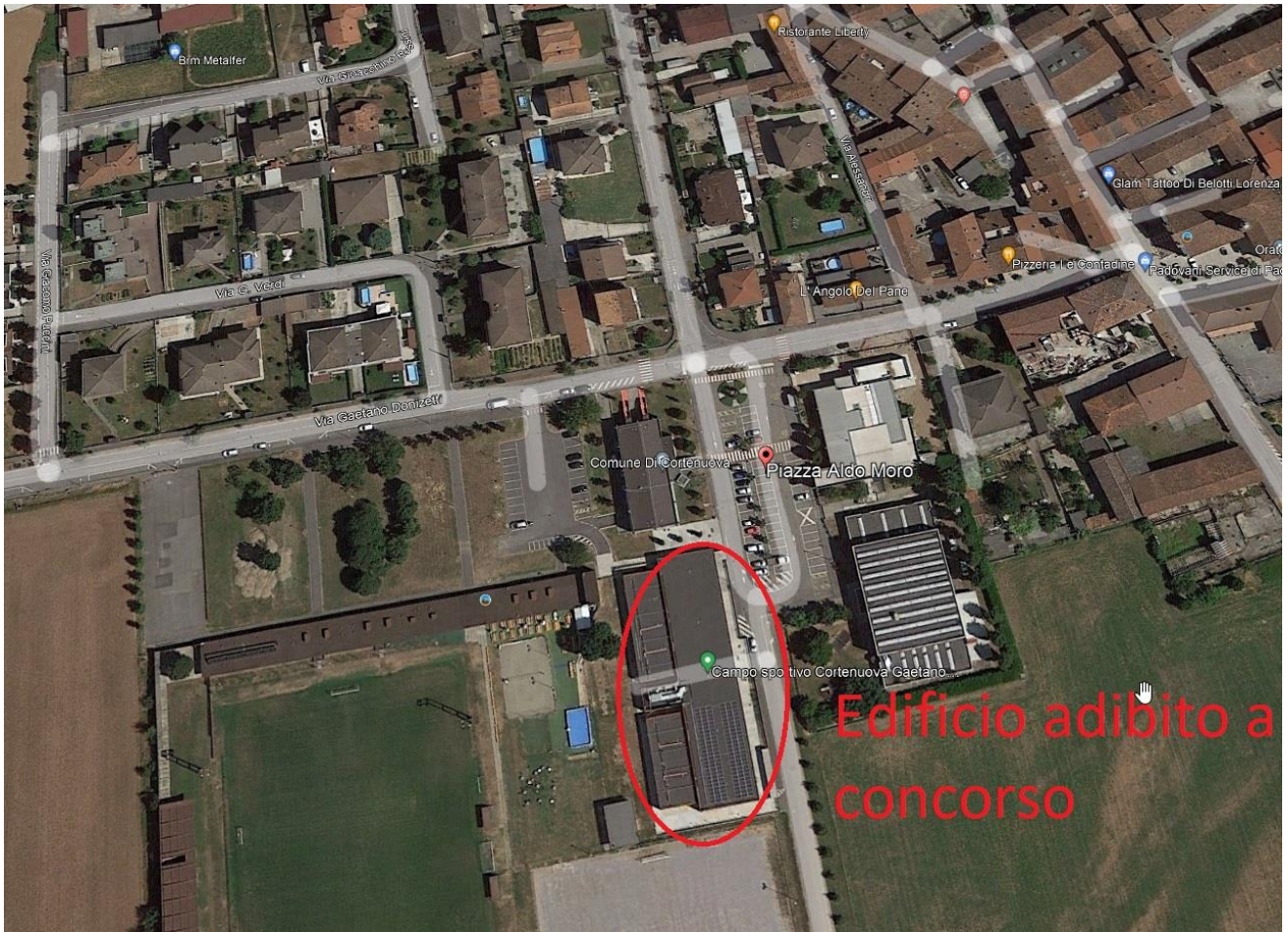
Scuola primaria di Cortenuova

La conformazione dell'area e della struttura garantisce di istituire una zona pre-triage per le verifiche di rito da svolgersi prima dell'accesso all'aula di concorso, così come previsto dal Protocollo.