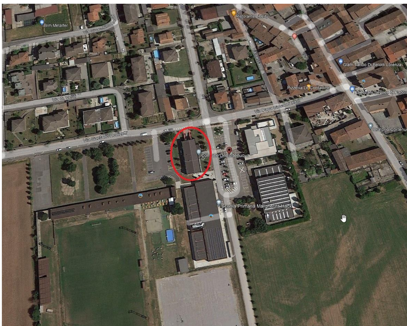
Municipio di Cortenuova

L'accesso all'area concorsuale avviene da una scala esterna che conduce, attraverso un atrio, all'ingresso della sala adibita per l'occasione a concorso.