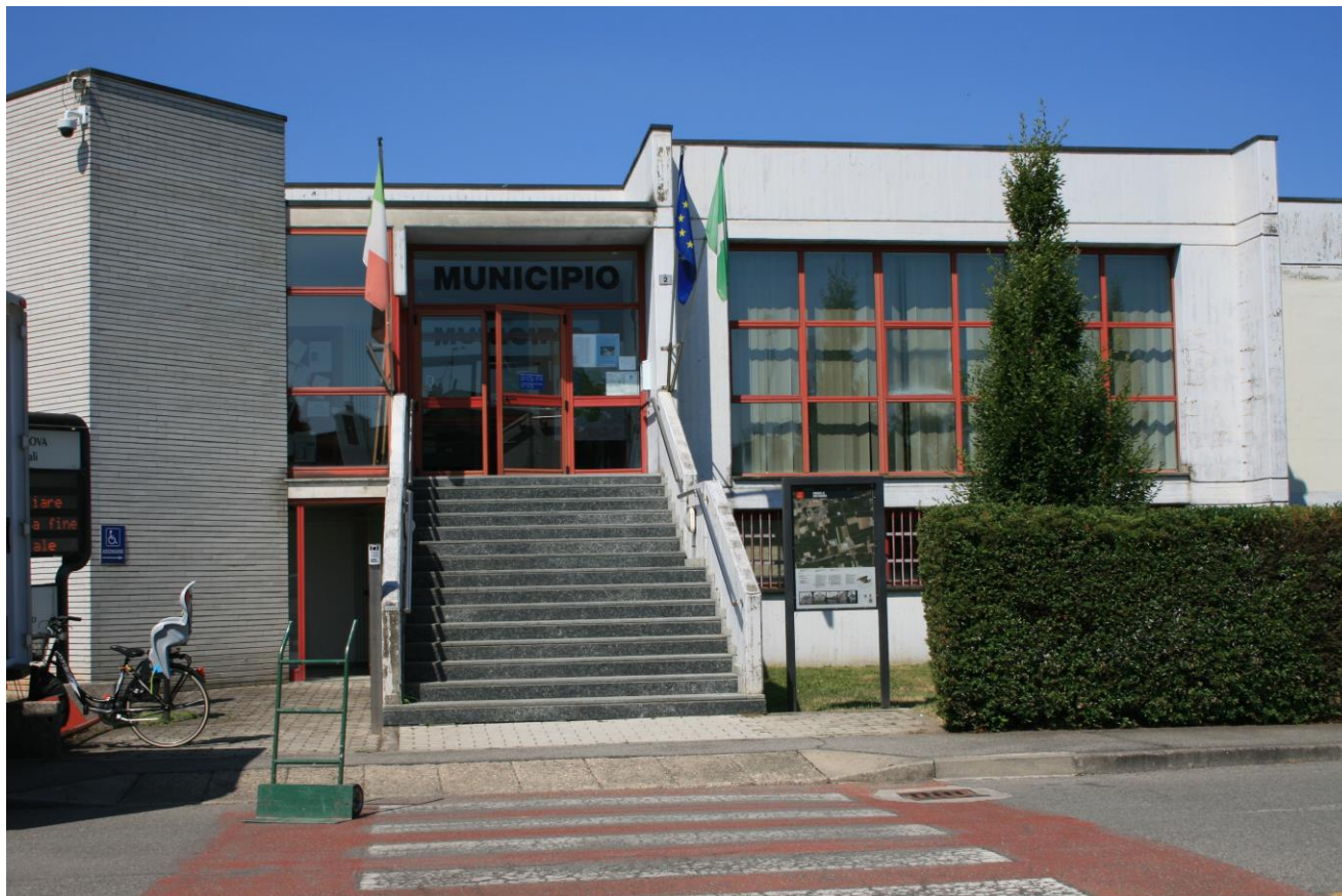
Edificio esterno Municipio

Inoltre, è possibile procedere al ricambio di aria all'interno della sala, qualora risultasse necessario, attraverso la serie di ampie finestre.